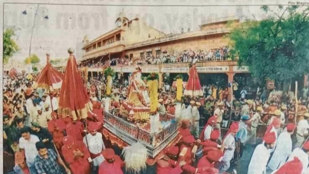
A procession of Gangaur being carried out from the Walled City area on Friday. (Below) Artists seen performing in the procession