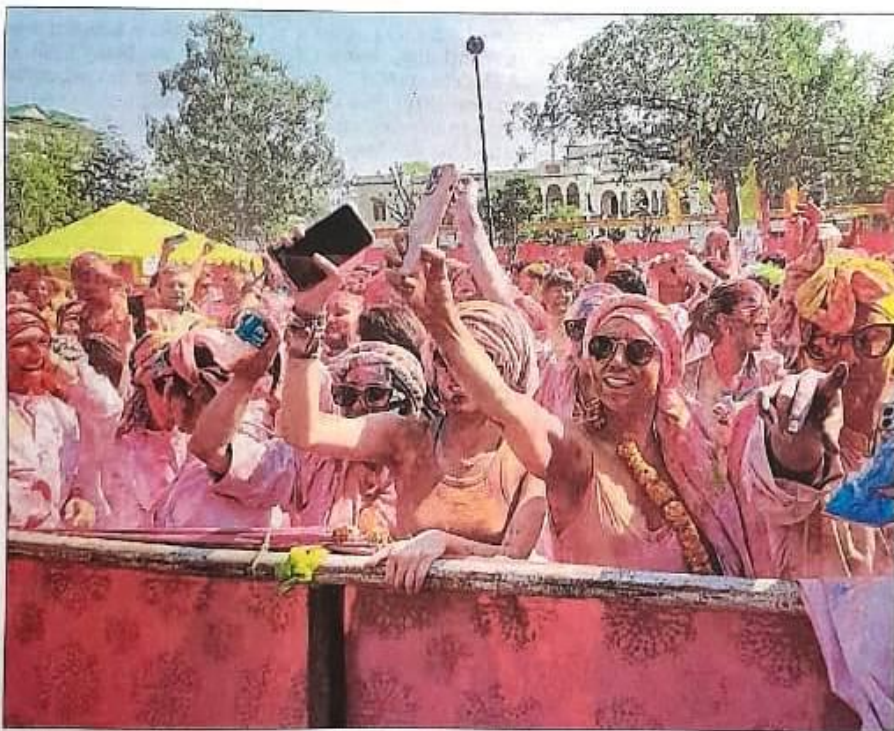
Foreigners playing Holi at Khasa Kothi in Jaipur on Tuesday.