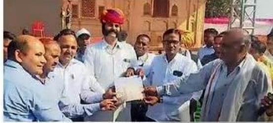
डीग. मूँछ प्रतियोगिता में विजयी प्रतियोगियों को सम्मानित करते हुए।