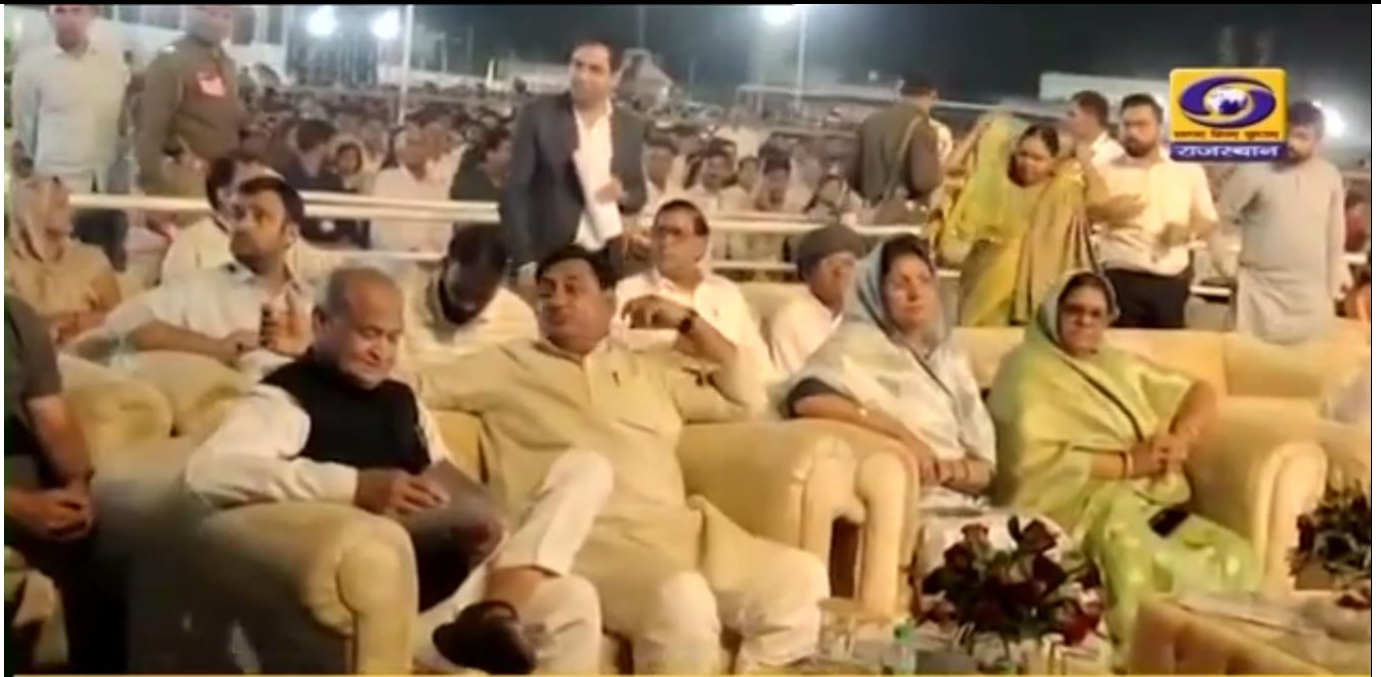
हेतु मुख्यमंत्री अशोक गहलोत ने 5 करोड़ 18 लाख रुपये 14:35