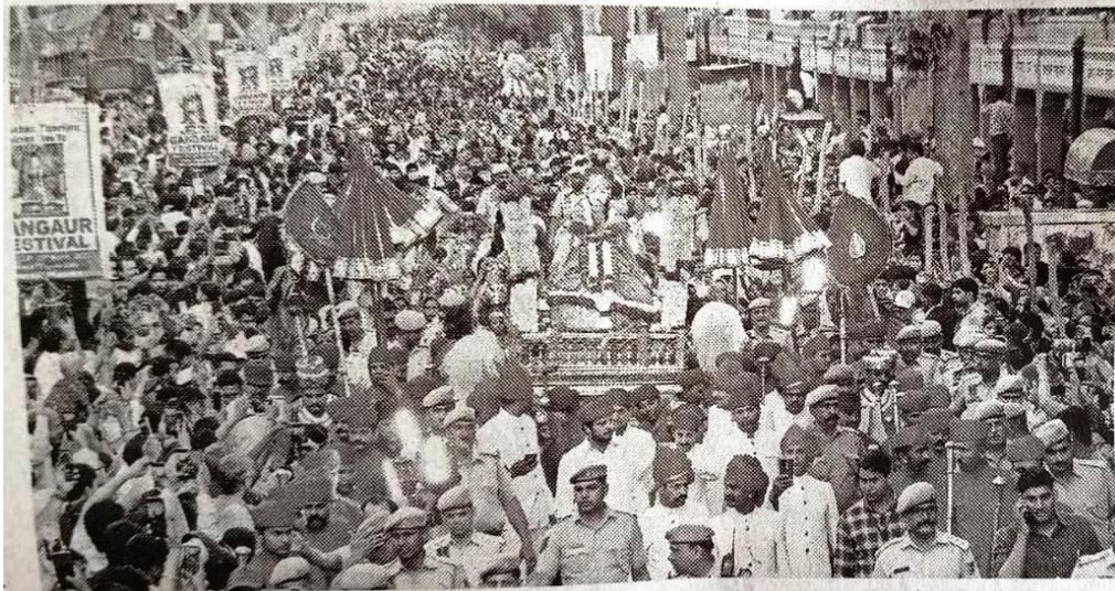
SEA OF DEVOTEES People take part in a Gangaur procession at Tripolia Gate in Jaipur on Friday Rohit Jain Paras